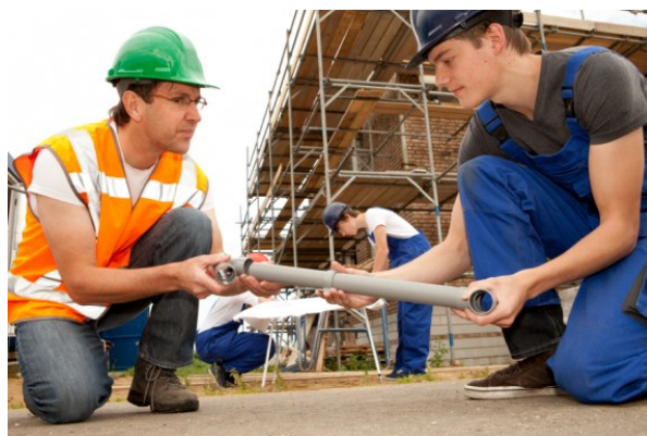
pomembnost vrednote dela

verjetje v zmožnost doseganja cilja, zaupanje vase pri sprejemanju odločitev