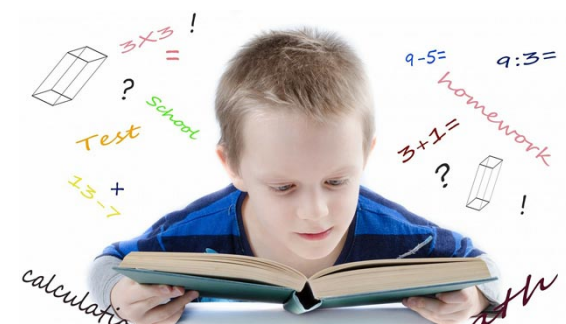
obvladanje učinkovitega učenja