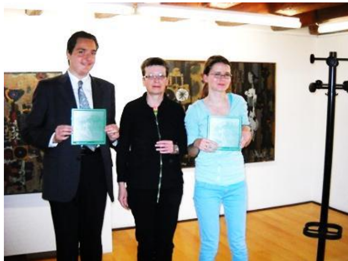
14. maj 2014: zaključni sestanek z dijaki literati na šoli, povzetek mnenj, izročitev priznanj za literarno udejstvovanje.