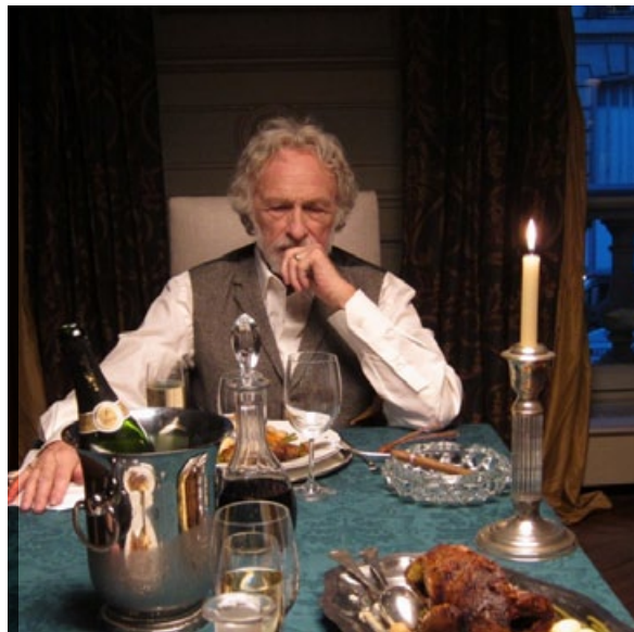
FILM IMA SLOVENSKE PODNAPISE.