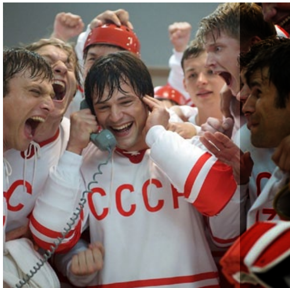
FILM IMA SLOVENSKE PODNAPISE.

2. september 1972. Montreal. Hokejska ekipa Sovjetske zveze je z ogromno razliko v rezultatu 7 : 3 premagala kanadske profesionalce iz NHL v uvodni tekmi superserije Sovjetska zveza – Kanada. To ni bila samo igra, to je bila bitka za svojo državo, ki je spremenila svetovno predstavo o hokeju. Od tedaj je Harlamova ves svet poznal preprosto kot številko 17. Valerij Harlamov, ki je v tej bitki zadel dva gola, je s tem takoj dosegel višek svoje slave. Njegove sanje so se uresničile – vztrajnost, športni talent in naporni treningi velikega trenerja Anatolija Tarasova so ustvarili iz številke 17 legendo svetovnega hokeja.