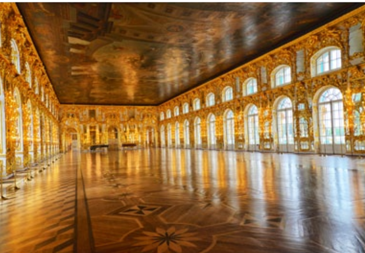
St.Petersburg, Tsarskoye Selo, Catherine Palace, The Grand Hall.